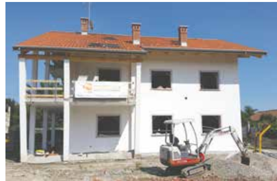
Casa gas free in corso di realizzazione a Pinerolo

E se l'utente volesse liberarsi anche della bolletta elettrica? Esiste già anche questa possibilità: installando un impianto fotovoltaico con